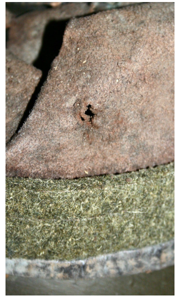
Trou dans le revêtement intérieur du casque.

De cet examen, on peut déduire qu'une balle a percé le casque, frappant mortellement le jeune lieutenant à la tête. Son casque, tombé à terre, a été percé ultérieurement par un shrapnel.