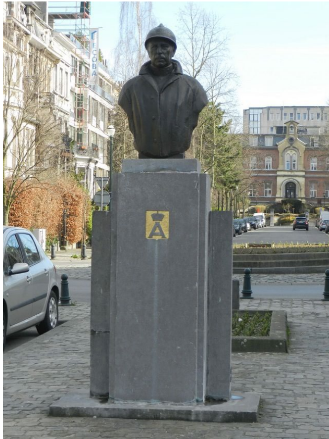
Monument à Ixelles