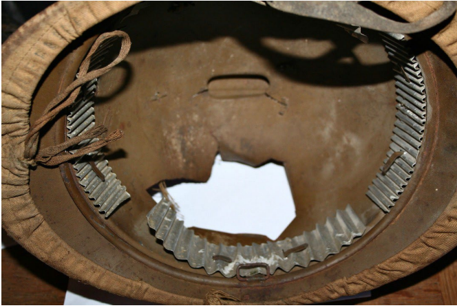
Vue du casque, revêtement intérieur enlevé.