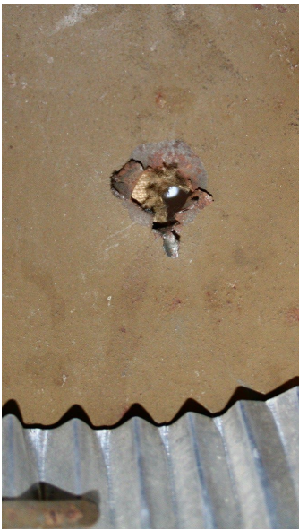
Trou de la balle dans le casque, vu de l'intérieur.