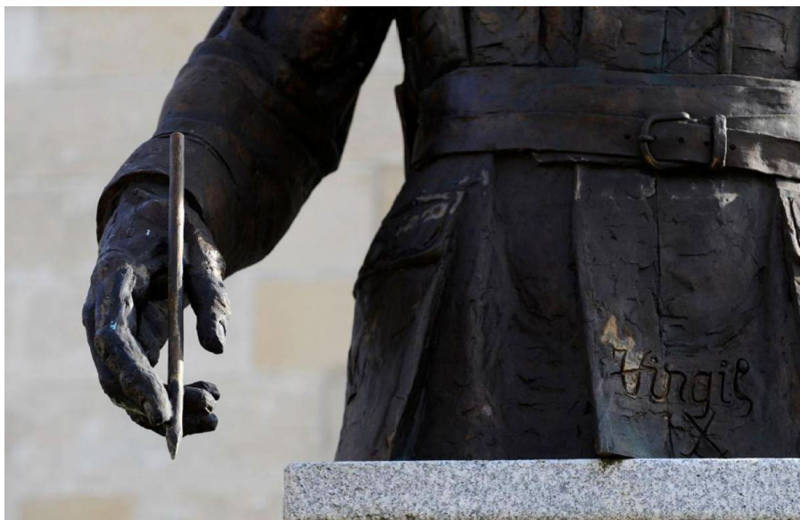
Monument en hommage à Maurice Genevoix (1890-1980) aux Eparges